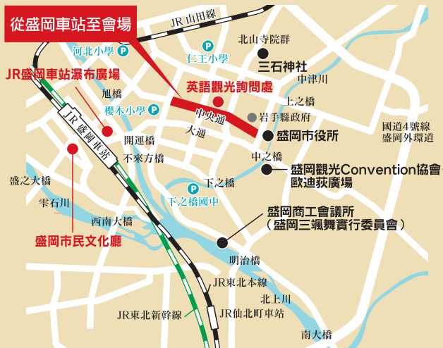
從盛岡車站徒步至遊行會場約20分